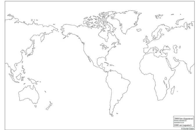
2000 km (équateur) 1000 mi (équateur) © Daniel Orléan

Est-ce que ce sont de vrais planisphères ?